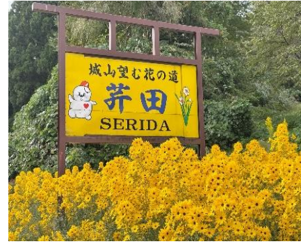
【例】周囲景観と調和した集落看板

届出行為の必要な案件がありましたら、まずは安塚区総合事務所総務・地域振興グループまでお問合せください。 ☎592-2003