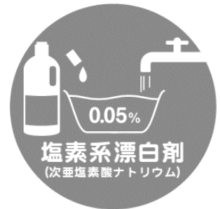
塩素系漂白剤 (次亜塩素酸ナトリウム)