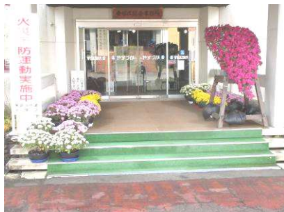
安塚区総合事務所