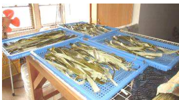
皮むき後の楮（乾燥中）

10月26日、雪だるま物産館脇で楮の釜茹で・皮むき作業を行いました。 当日は天候にも恵まれ、8名の皆さんで1釜分の作業を行いました。