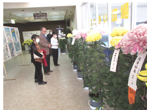
安塚コミュニティプラザ

「NPO 雪のふるさと安塚」事務局は 安塚コミュニティプラザ館内です。いつでもお気軽にお立ち寄りください。 また、コミュニティプラザの利用やNPO 雪のふるさと安塚に対する意見要望もお寄せください。