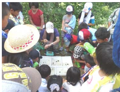
水辺の生き物観察