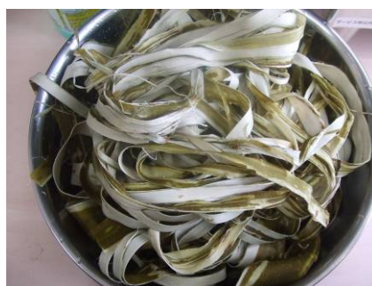
黒皮をむいたもの