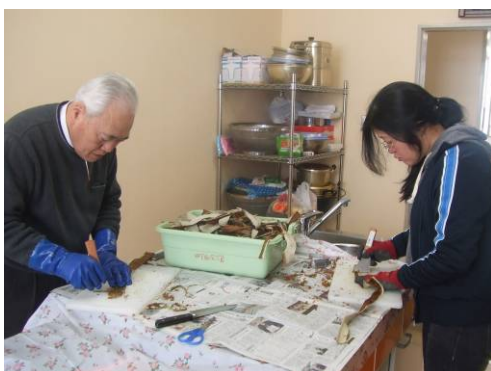
ひとつひとつ手作業です