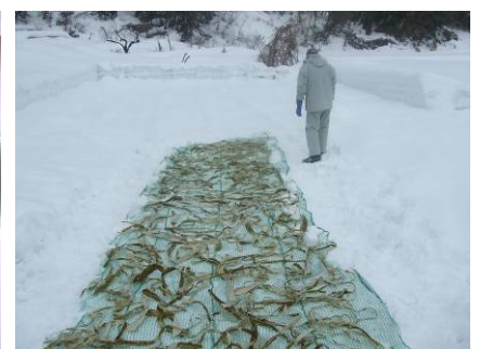
雪の上に並べていきます